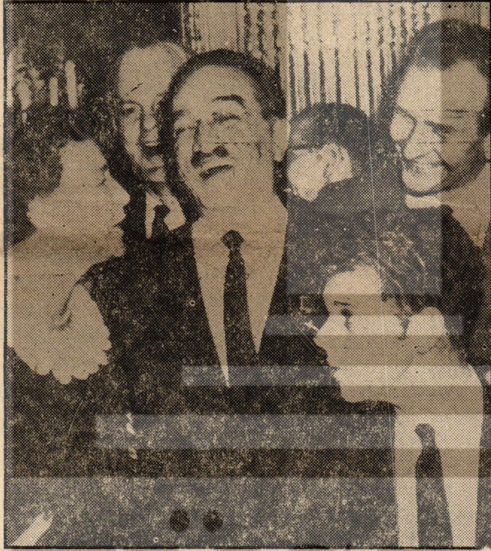
MİKÖYAN—Sovyetler Birliği Devlet Başkanı

Atatürk'ten bu yana heder edilmiş olan Türk ve Sovyet halk Cumhuriyetleri dostluğu yeniden düzelmek temayülü göstermektedir. Bu münasebetle Dışişleri Bakanımız Erkin başkanlığındaki heyet cuma günü Rus yapısı İlyuşin tipi özel bir uçakla Rusya'ya hareket etti. Hareketi sırasında Taas Ajansına bir demeç veren Erkin şöyle demiştir. Büyük liderlerimiz Atatürk ve Leninin kurmuş oldukları dostluğu yaşatmalıyız. Rusya'da Sovyet halkının başardığı büyük hamleleri göreceğimden memnunum. Devamla Sovyetlerin barış içinde beraber yaşama prensibinin Türkiye'de memnurluk uyandırdığını, bu prensibin ışığında Türkiye'nin münasebetleri geliştirmeye hazır olduğunu son zamanlarda bu konuda müsbet inkişaflar müşahade edildiğini söylemiştir. Türk heyetini taşıyan uçak Sereye Mentevo hava lanına inmiş heyetimiz Dışişleri Bakanı Gromyko kalabalık basın mensubu karşılamışlardır. Heyetimiz şerefine verilen yemekte Türk Rus dostluğunun yeni den ihya edilmesi karşılıklı büyük mutluluğa vesile olmuş Türk-Rus dostluğu şerefine Gromeyko iki defa ka deh kaldırmış ve şöyle demiştir. «Biz Türk-Rus dostluğunun tam manası ile samimi olmasını istiyoruz. Son zamanlarda iyi adımlar atıldı ancak yapılacak çok şeyimiz (Devamı 4 de)